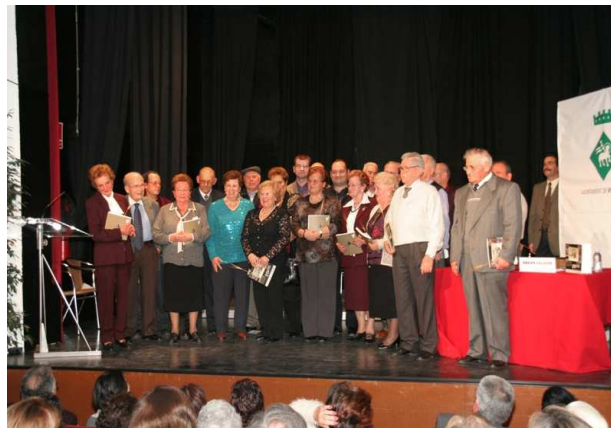
5. Presentació del llibre 20 històries de vida , compilat per en Xavier Calderé i editat per l'Arxiu Municipal, l'any 2007.